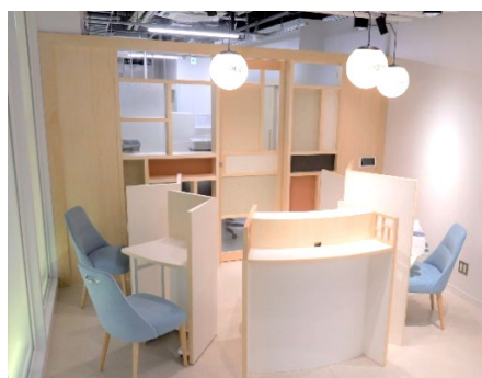
受付：独自の個別呼び出しアプリを導入

なお、「東洋医学センター 柏の葉鍼灸院」は、千葉大学柏の葉キャンパスにおいて診療を継続しています。