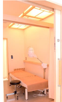
鍼灸治療室：照明、音響、換気の工夫