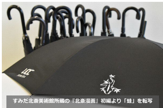
すみだ北斎美術館所蔵の『北斎漫画』初編より『蛙』を転写